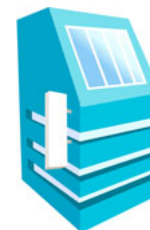
Zunanji izvajalec - SI-RS-D