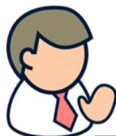
Zakoniti zastopnik predlagatelja