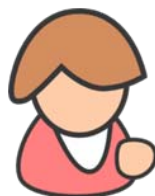
Računovodja pri predlagatelju